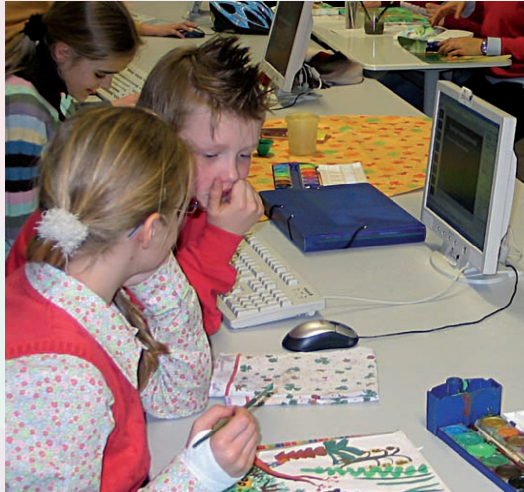
Links: Kunstunterricht am Heinrich-Heine-Gymnasium bedeutet Kreativität, modernste Technik und Gemeinschaftssinn.

Und weil das genaue Hinschauen so wichtig ist, untersuchen wir Bilder sehr genau und gehen regelmäßig in Museen und Ausstellungen. Denn von und mit Bildern lernen wir – das genaue Gucken ebenso wie Interessantes über unsere Wahrnehmung, über die Künstlerinnen und Künstler und ihre Zeit, über Techniken, Materialien, Farben.