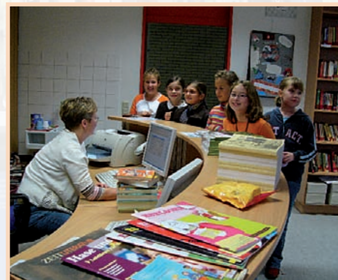
Professionelles Ausleihsystem dank engagierter Mütter und guter Ausstattung.

Doch soll unsere Bücherei auch eigenständige Zugänge zu Wissensquellen eröffnen. Zahlreiche Lexika und Fachbücher – auch in einem Präsenz-bereich – werden ergänzt durch zwei Computer zur Internetrecherche. Ein Kopiergerät komplettiert die Ausstattung. Hier wird das selbstständige Arbeiten für die Schülerinnen und Schüler zur Gewohnheit, hier können sie sich für Hausaufgaben, Klassenarbeiten, Referate, Facharbeiten und für das Abitur Informationsmaterial beschaffen und es auswerten. Unterrichtsthemen und -methoden, Projekte im Literaturkurs, Veranstaltungen rund um das Buch, Bücherflohmärkte und Lesungen beziehen die Schülerbücherei mit ein – ein lebendiges Zentrum im Schulalltag des Heinrich-Heine-Gymnasiums.