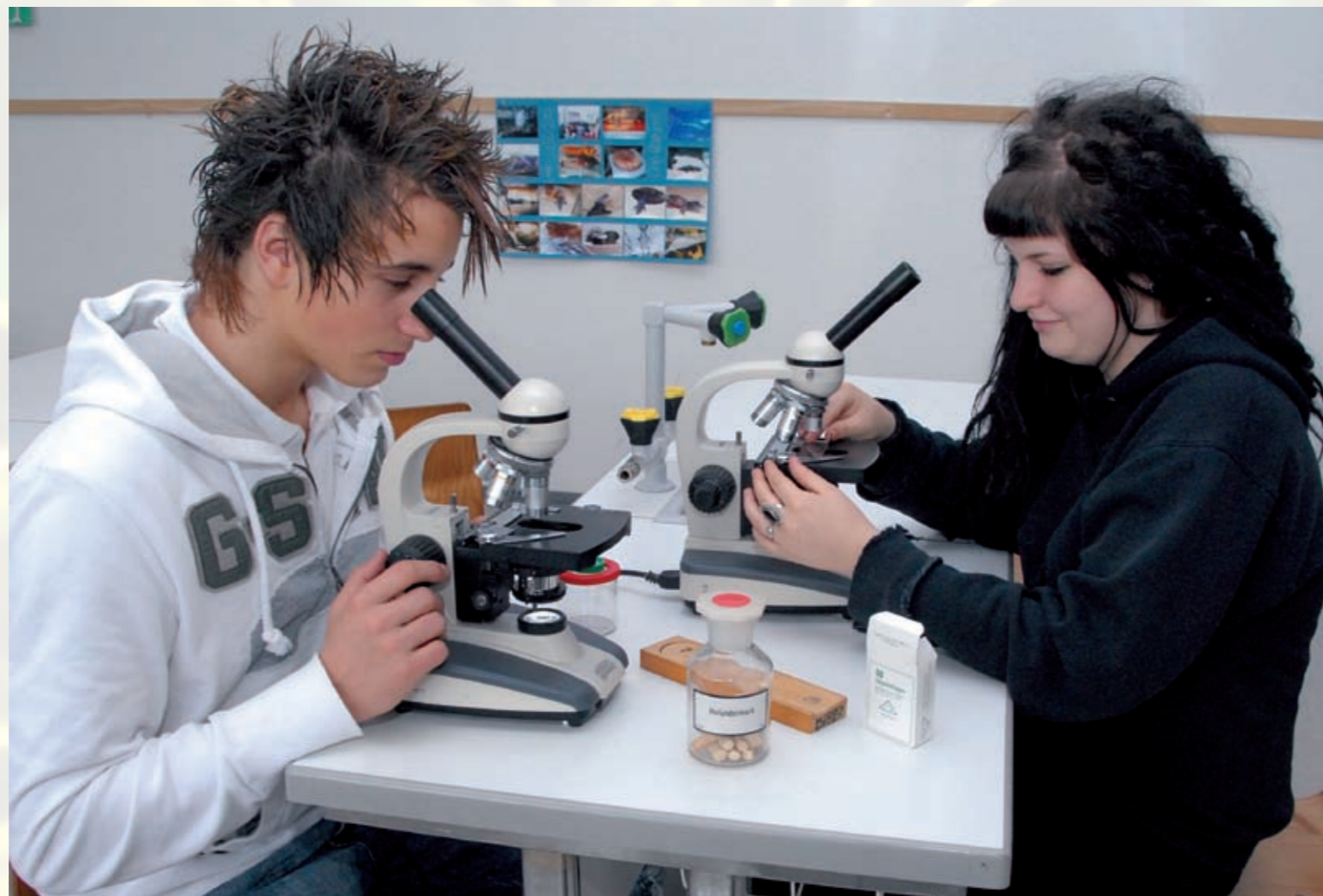
Großes Foto: Biologie am Heinrich-Heine-Gymnasium – die Erforschung des Mikrokosmos erfordert höchste Konzentration. Kleines Motiv: Teilnehmer eines Physik-Leistungskurses beim schulinternen Wettbewerb „Heine forscht“.

Regelmäßige Zusammenarbeiten mit Fachinstituten, z. B. Exkursionen zum Elektronenmikroskop an der Universität Duisburg-Essen, vertiefen die naturwissenschaftliche Arbeit.