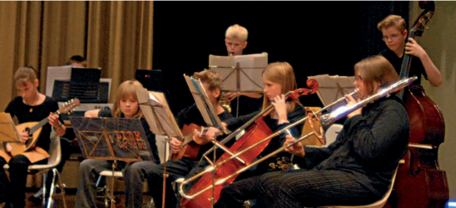
Unterstufenorchester anlässlich des 100-jährigen Bestehens des Heinrich-Heine Gymnasiums – ein Musikerlebnis für alle.